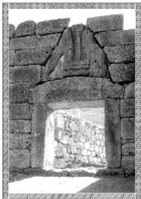
PUERTA DE LOS LEONES

al Cristo Interno, el cual carga con mucho del peso de nuestro karma. Visto desde arriba todo el conjunto tiene forma circular, lo que viene a representar a la "Presencia Yo Soy" envolviéndolo